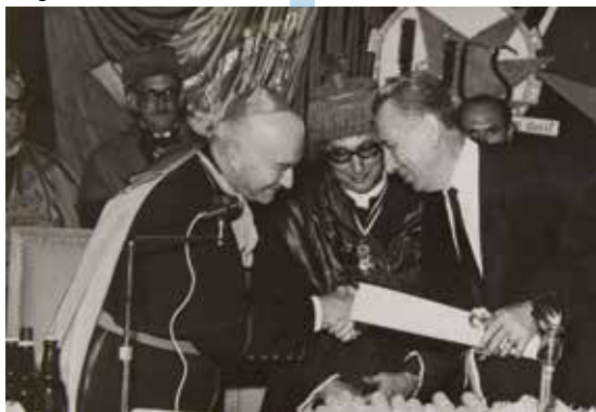
1967 Formatura dos alunos da Faculdade de Filosofia da UCS e entrega de título Honoris Causa ao Deputado Tarso Dutra, que teve papel fundamental como articulador na criação da Universidade.