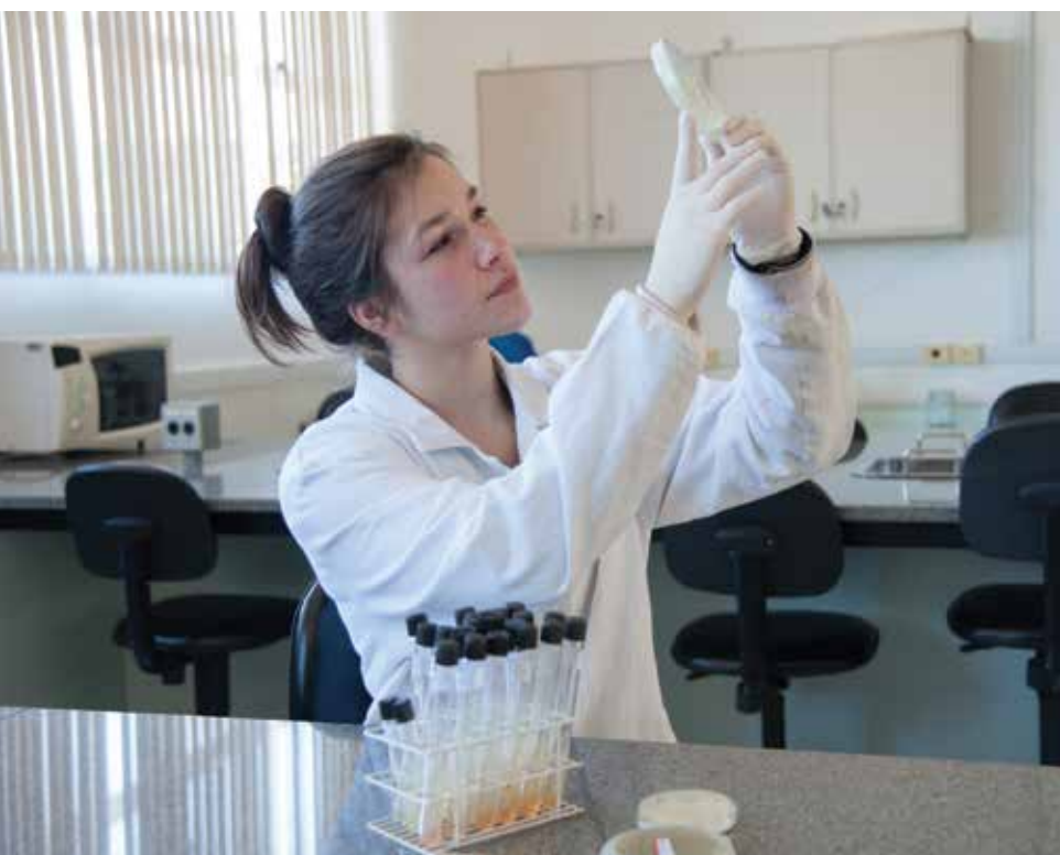
Claudia Velho | UCS

(Acima, retrato de família de imigrantes italianos em 1904. Foto de Domingos Mancuso, Acervo Histórico Municipal João Spadari Adami)