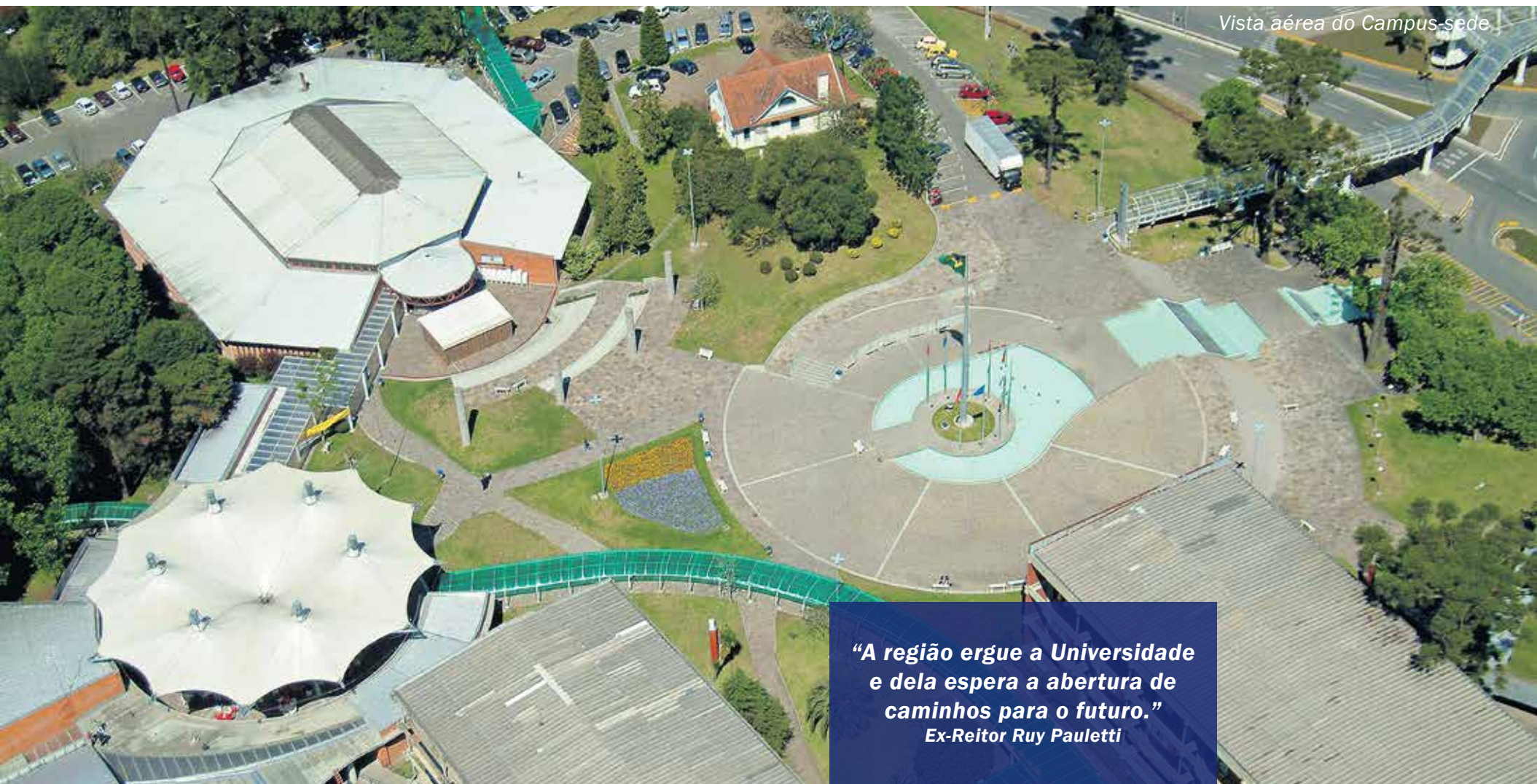
Vista aérea do Campus-sede

A criação de núcleos e a posterior transformação em campi resultou no atual cenário de abrangência. Além de unidades em Caxias do Sul, há o Campus Universitário de Vacaria (CAMVA), o Campus Universitário da Região dos Vinhedos (CARVI), o Campus Universitário Vale do Caí (CVALE), o Campus Universitário da Região das Hortênsias (CAHOR), o Campus Universitário de Farroupilha (CFAR), o Campus Universitário de Guaporé (CGUA) e o Campus Universitário de Nova Prata (CPRA). O Núcleo Universitário de Veranópolis, criado em 1995, teve as atividades encerradas em 2015. Com uma forte inserção regional, a UCS busca, continuamente, alternativas inovadoras de promoção do desenvolvimento social, seja na formação de pessoal, na construção de novos conhecimentos e tecnologias ou na criação de espaços que favoreçam o avanço científico, artístico, tecnológico e cultural da sociedade. Para viabilizar uma maior integração com a comunidade, participa de diferentes entidades que visam ao desenvolvimento regional, como os Conselhos Regionais de Desenvolvimento (Coredes) das regiões da Serra, das Hortênsias, do Vale do Caí e dos Campos de Cima da Serra, a Aglomeração Urbana do Nordeste e os comitês de Gerenciamento da Bacia Hidrográfica Taquari-Antas e Caí.