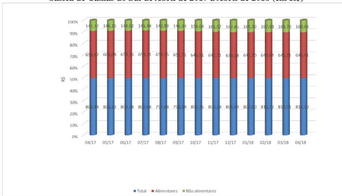
Figura 2: Evolução do custo com produtos alimentares e não alimentares da Cesta básica de Caxias do Sul de Abril de 2017 a Abril de 2018 (em R$)

Fonte: Instituto de Pesquisas Econômicas e Sociais - IPES/UCS