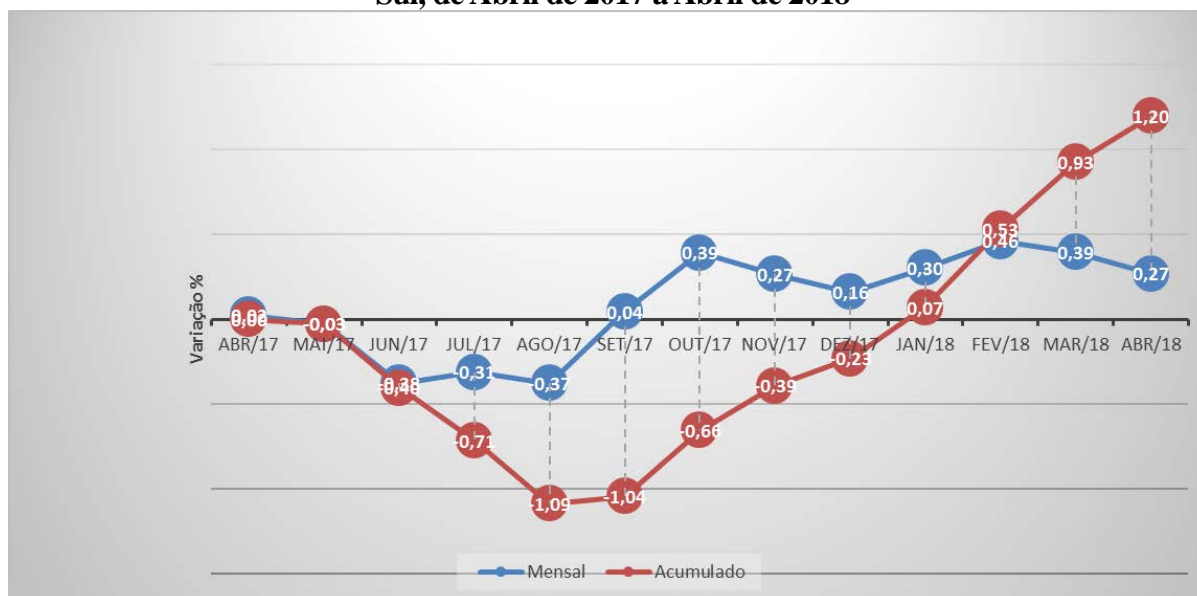
Figura 3: Variação percentual mensal e acumulada do custo da Cesta básica em Caxias do Sul, de Abril de 2017 a Abril de 2018