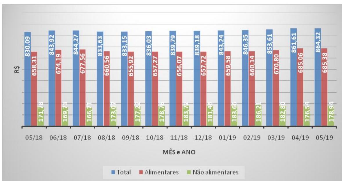
Figura 2: Evolução do custo com produtos alimentares e não alimentares da Cesta básica de Caxias do Sul de Maio de 2018 a Maio de 2019 (em R$)