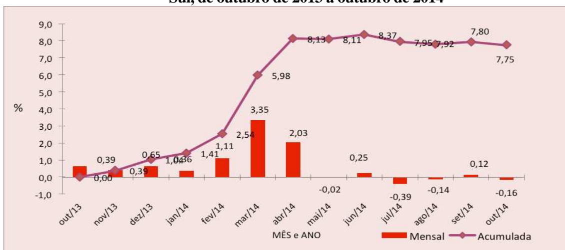
Figura 3: Variação percentual mensal e acumulada do custo da cesta básica em Caxias do Sul, de outubro de 2013 a outubro de 2014