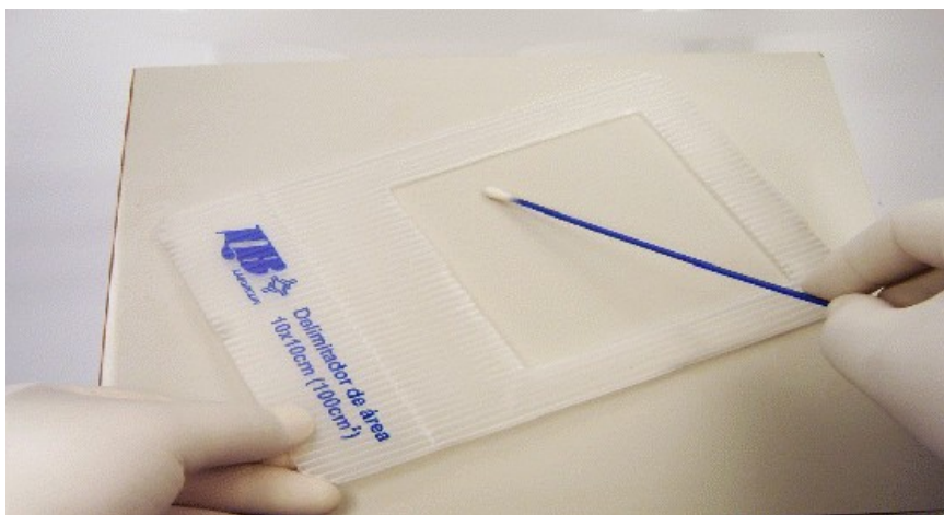
Figura 2: coleta para swab superfícies planas

2.2.3 Conforme Figura 2, o swab deve ser friccionado com pressão, formando um ângulo de 30° com a superfície teste, vinte vezes na forma “zigue-zague”, nos sentidos das diagonais, na área de coleta da superfície, no espaço delimitado pelo molde. Deve-se rodar continuamente o swab , para que toda a superfície do algodão entre em contato com a amostra.